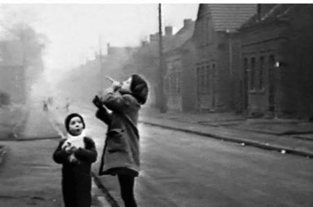
Screenshot aus dem Film Mülheim (Ruhr) 1964

Dienstag, 3.12.2024_18 Uhr Welterbe Zollverein, Halle 6