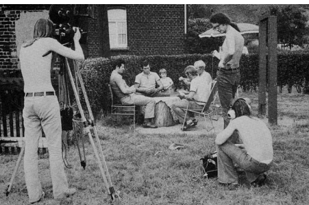
Dreharbeiten zu dem Dokumentarfilm Rettet Eisenheim 1972/73