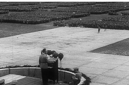
Screenshot aus dem Wochenschaubericht Gauparteitag der NSDAP in Essen 1935 , am Rednerpult Joseph Goebbels

24. Juni 1921, 35 mm, 7 Min. Wochenschaubericht zum Trauerzug durch Herne für die 85 Opfer der Grubenkatastrophe auf Zeche Mont-Cenis I/III in Herne-Sodingen vier Tage zuvor.