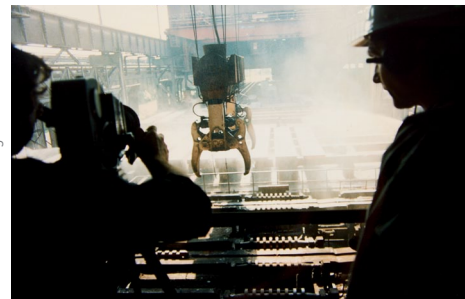
Dreharbeiten zu dem Film Ofen aus im August 1993, © Paul Hofmann/ Kinemathek im Ruhrgebiet