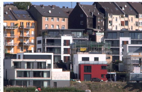
Dortmund-Hörde, Szenefoto aus dem Film Göttliche Lage