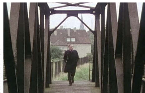
Screenshot aus dem Film Vom alten Eisen 1982

Dienstag, 7.1.2025_18 Uhr Welterbe Zollverein, Halle 6