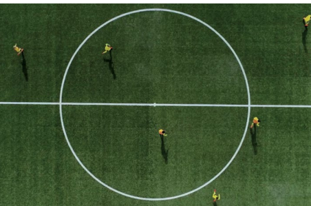
Szenenfoto aus dem Film Nachspiel