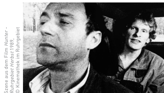
Szene aus dem Film Hunter - Ruhrgebiet Herbst 1989 .

2018, DVD, 55 Min., von Daniel Huhn Untergang und Wiederauferstehung von auch im Ruhrgebiet höchst unterschiedlichen Orten, „die Filme zu einem Kino- erlebnis gemacht haben und immer noch machen“.