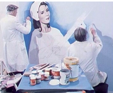
Screenshot aus dem Film Wie in alten Zeiten 1982

Dienstag, 4.2.2025_18 Uhr Welterbe Zollverein, Halle 6