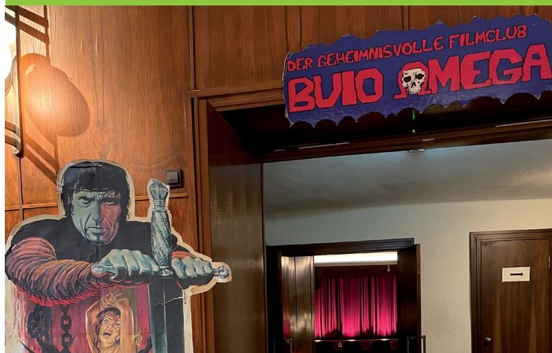
Foto: Aufsteller und Vereinschild des Filmclubs mit Blick in den Kinosaal