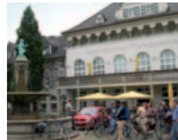
Radtour zur Siedlung Margarethenhöhe

Die Rundfahrt führt zu Orten der Krupp'schen Werks- und Familiengeschichte in Essen, Bochum und Dortmund. Besucht werden u.a. das ehemalige Kruppengelände, der Friedhof Bredeneu und die Villa Hügel, die Dahlhauser Heide und die Zeche Hannover in Bochum, sowie das Hoerschmuseum mit dem virtuellen Stahlwerk in Dortmund. Max. 48 Teiln., 34 €, ermäßigt 28 €