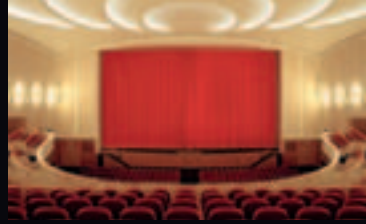
Lichtburg Essen

Do 28.6._19 Uhr Zollverein, Halle 2 Rheinhausen und die Friedrich-Alfred-Hütte * Die Friedrich-Alfred-Hütte in Rheinhausen am Niederrhein, um 1932, 15 Min./ * Ein Gang über die Hütte, 1950/51, 30 Min./ Erinnerung an Rheinhausen, 1989,