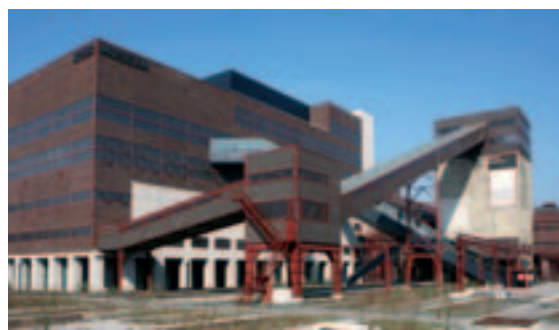
Das Ruhr Museum in der Kohlenwäsche auf Zollverein