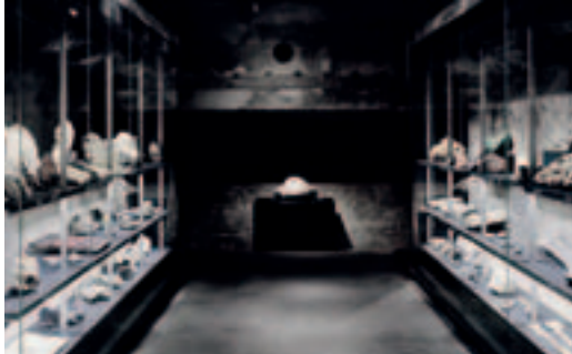
Geologische Sammlung

Ort: Halbachhammer im Nachtigallental, Margarethenhöhe, Kostenlos, ohne Anmeldung