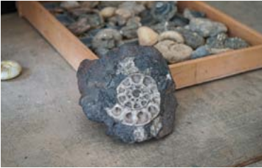
Workshop „Fossilien fälschen“