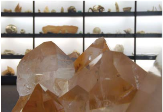
Dauerausstellung Mineralien-Museum