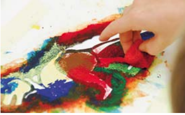
Kindergeburtstag „Dino-Party“