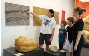
Familienführung „Aus Mineralien besteht die Welt“