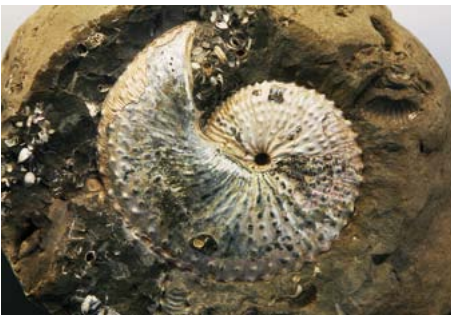
Ammonit; Foto: Rainer Rothenberg