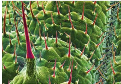
Brennnesseln mit rot gekennzeichneten Stacheln aus \text{SiO}_2