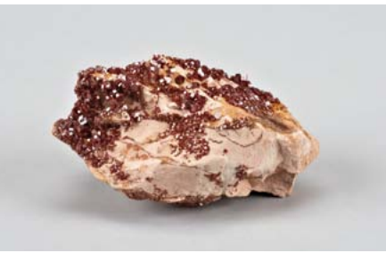
Vanadinit, Privatsammlung Hänisch 1984