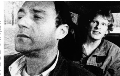
Szene aus dem Film Hunter - Ruhrgebiet Herbst 1989.

Dienstag, 18.2.2025_18 Uhr Welterbe Zollverein, Halle 6