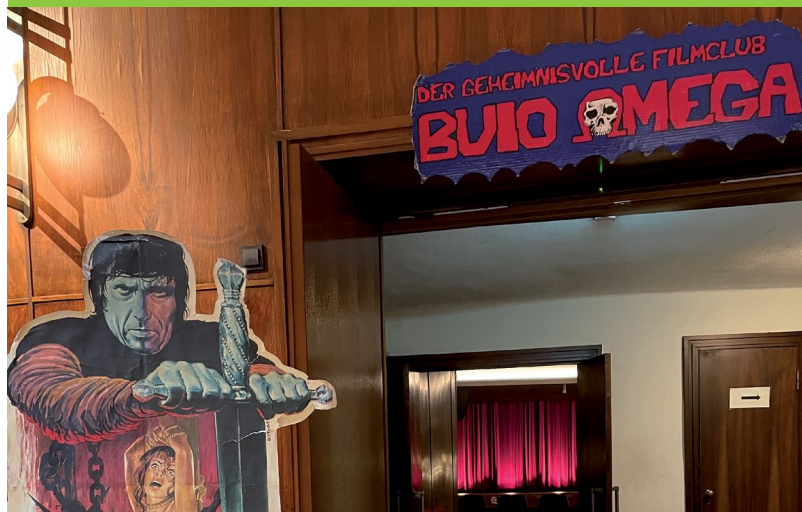
Foto: Aufsteller und Vereinschild des Filmclubs mit Blick in den Kinosaal