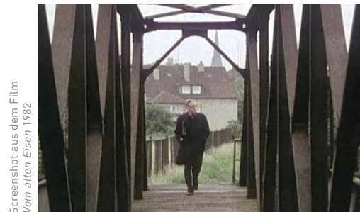
Screenshot aus dem Film Vom alten Eisen 1982

Berliner Filmstudenten engagieren sich mit ihren filmischen Möglichkeiten für den Erhalt der Gelsenkirchener Arbeitersiedlung.