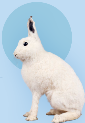
Schneehase im Winterkleid (LWL-Museum für Naturkunde, Münster)

Spannende Geschichten verständlich erzählt und nah an den Objekten. 60 Minuten voller Hintergründe, überraschenden Fakten und neuen Perspektiven.