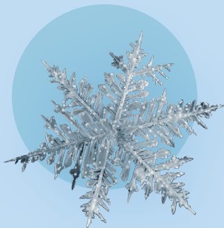
Eiskristall aus der Arktis

10 €, ermäßigt 7 €, 3 Std., Anmeldung: besucherdienst@ruhrmuseum.de , Tickets: www.tickets-rm.de